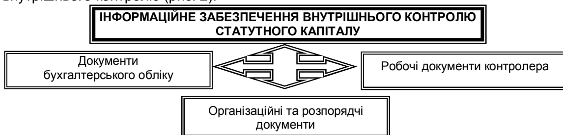
Рис. 2. Класифікація інформаційного забезпечення внутрішнього контролю статутного капіталу

Здійснення контролю досить часто представляється у вигляді певної послідовності етапів, кожен з яких передбачає сукупність здійснюваних процедур. При цьому думки авторів щодо черговості етапів та їх змісту нерідко відрізняються. Проте у будь-якому випадку дії, що здійснює контролер під час перевірки, свідчать про постійну необхідність інформації. Сукупність документів, з якими має справу контролер складають інформаційне забезпечення процесу проведення внутрішнього контролю (рис. 2).