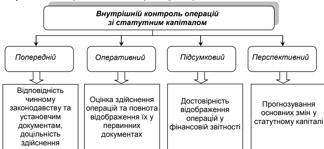
Рис. 3. Характеристика внутрішнього контролю операцій зі статутним капіталом

Слід зазначити, що в сучасній економічній літературі, присвяченій дослідженню організації та методології контролю деякі автори або взагалі не висвітлюють методіку контролю статутного капіталу, або торкаються доволі опосередковано (при розгляді контролю формування і використання власного капіталу). Господарські операції, пов'язані з формування та зміною статутного капіталу можна перевірити шляхом попереднього, поточного або оперативного, підсумкового та перспективного контролю (рис. 3).