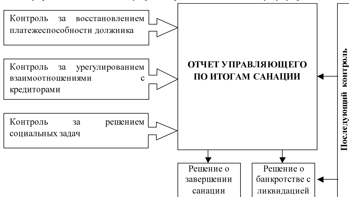
Рис.3. Последующий контроль при завершении санации

Последующий контроль отличается углубленным изучением хозяйственной и финансовой деятельности хозяйствующего субъекта за определенный период. Его результаты тесно связаны с результатами предварительного или текущего контроля, что позволяет вскрыть недостатки их проведения. Результаты последующего контроля представляются антикризисным управляющим в форме отчета управляющего комитету кредиторов и хозяйственному суду (рис.3).