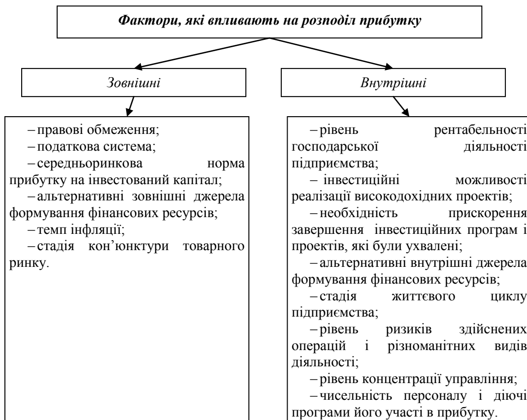
Рис.1 Види факторів, які впливають на розподіл прибутку