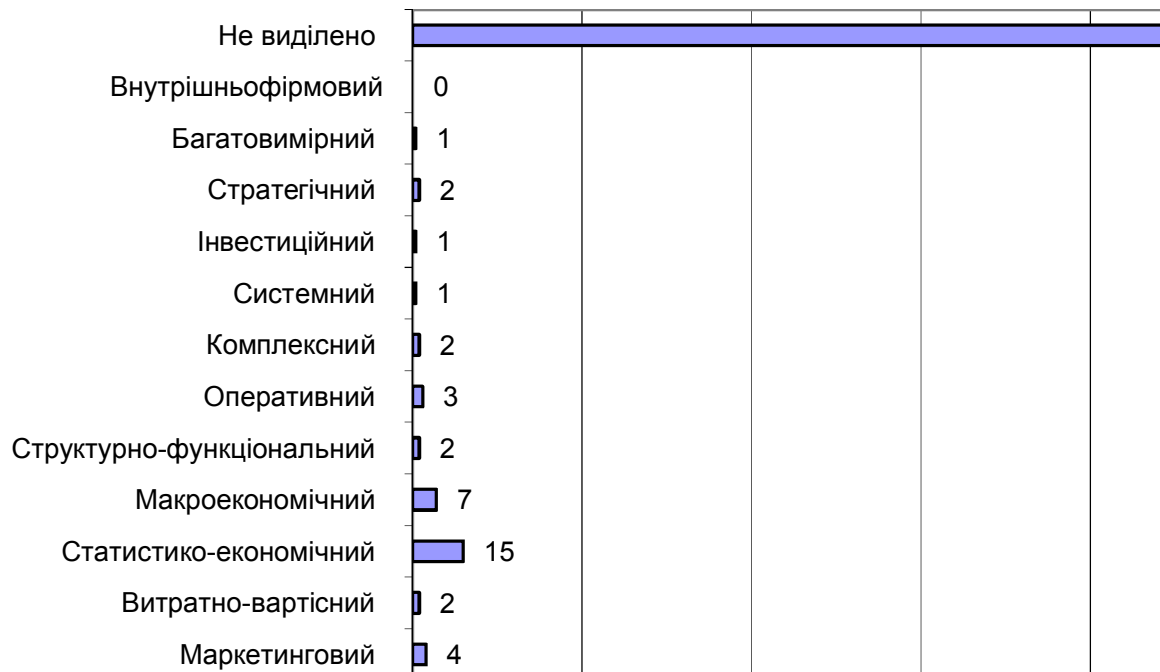
Рис. 2. Захищені кандидатські дисертації аналітичного напрямку за змістовним наповненням в Україні протягом 1968-2008 рр.

За змістовним наповненням економічного аналізу нами виділено 14 напрямів, які займають різну питому вагу в загальній кількості (рис. 2).