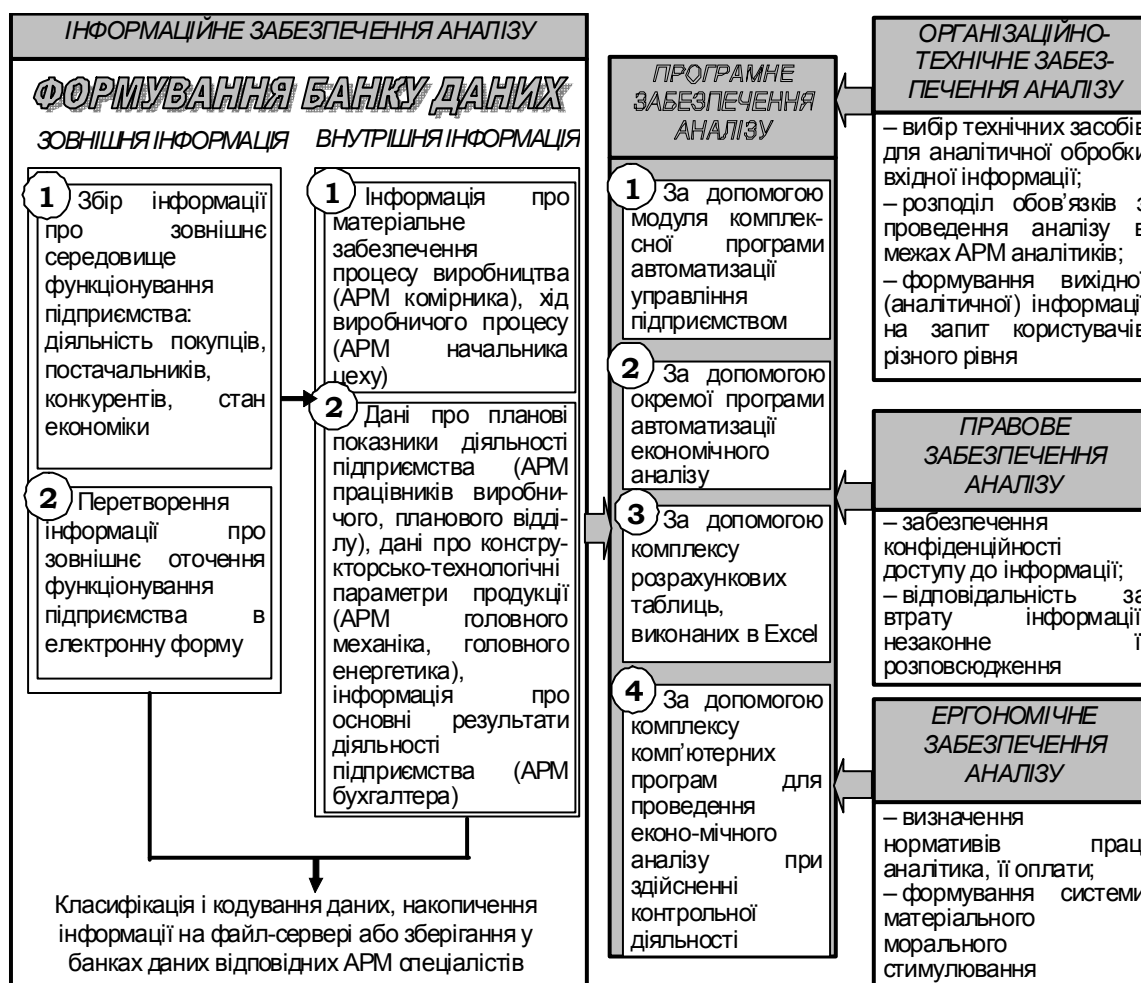
Рис. 4. Місце програмного забезпечення у підсистемах, які забезпечують проведення економічного аналізу

На великих підприємствах групуванням і обробкою первинної інформації, яка формується на відповідних АРМ спеціалістів і надходить із зовнішніх джерел інформації, займається програміст. Інформаційне забезпечення економічного аналізу складається з таких основних елементів: зовнішня і внутрішня інформація, системи класифікації і кодування даних. Основним компонентом інформаційного забезпечення економічного аналізу є банк даних, який виконує функції введення, накопичення, зберігання, оновлення, інтегрування обробки і видача інформації у будь-якій комбінації для вирішення регламентних завдань та інформаційно-довідкового обслуговування користувачів. За Митрофановим Г.В. основними вимогами до автоматизованих банків даних є: багаторазове використання даних при одноразовому їх вводі в систему; мінімальне дублювання; можливість розширення та оновлення; швидкий доступ до даних та їх захист; інтеграція даних для використання на різних рівнях управління [17, с. 74]. Вважаємо, що за рахунок дотримання вказаних вище вимог до баз даних є можливість підвищення ефективності функціонування інформаційних технологій через раціональну організацію і використання даних у процесі їх обробки. Визначеним чином закодована і класифікована інформація за відповідними розрізами та накопичена у банках даних відповідних АРМ спеціалістів використовується для проведення економічного аналізу.