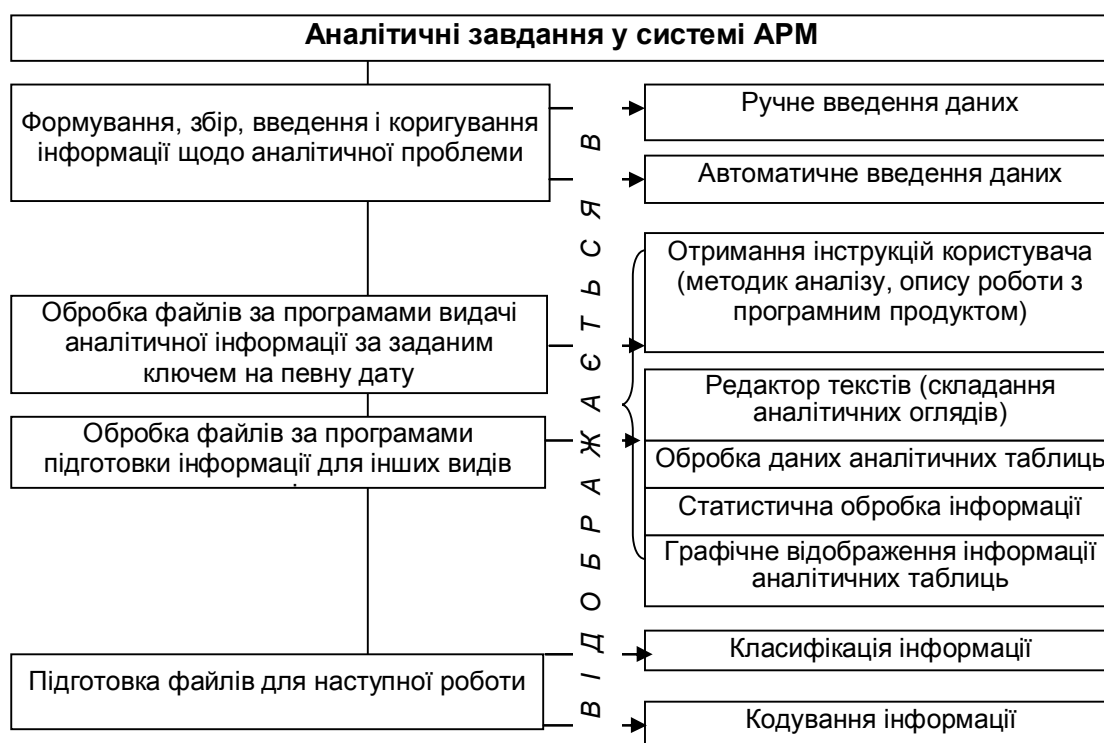
Рис. 2. Послідовність розв'язання аналітичних завдань у системі АРМ

Розподіляючи завдання аналізу в системі АРМ, необхідно забезпечити таку інтеграцію системи, за якої АРМ може існувати як автономна система та водночас бути частиною КІСП. Наложну реалізацію функціональних завдань забезпечує розробка технологічної карти розв'язання аналітичних завдань, які можуть бути представлені у наступній послідовності (рис. 2).