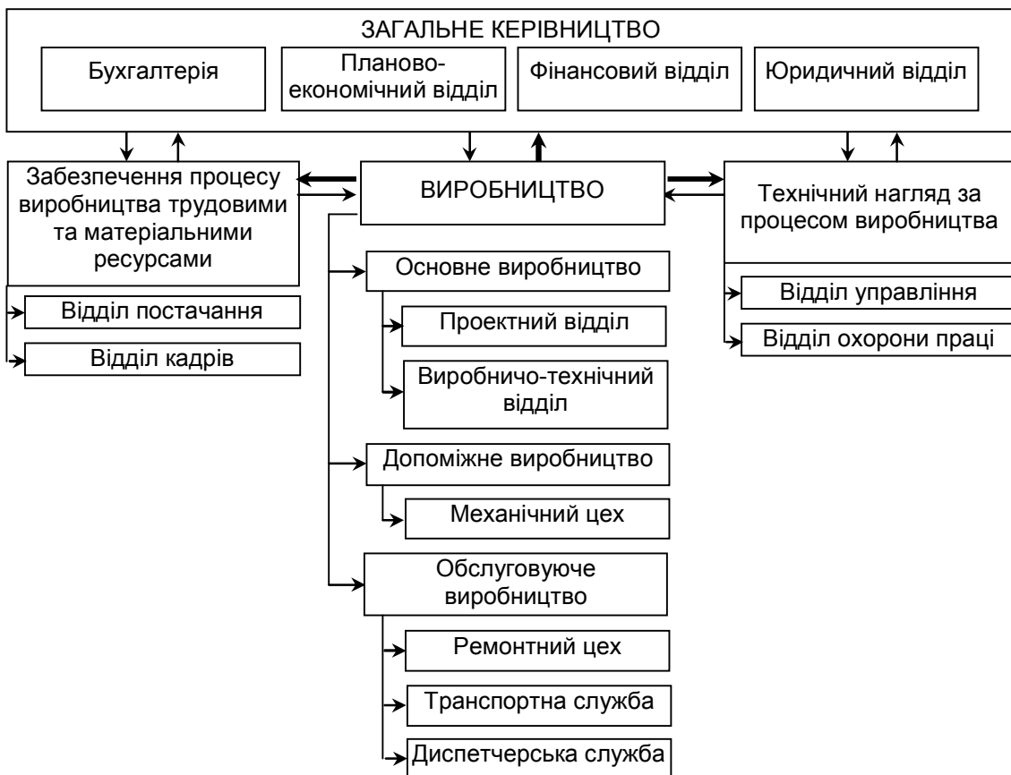
Рис. 2 Функціональний взаємозв'язок підрозділів будівельної організації в процесі будівельного виробництва [власна розробка]

Що стосується понять “місце виникнення витрат” та “центр витрат”, то єдиної думки у науковців щодо їх визначення не має. Деякі з них, такі як Атамас П.Й. [1], Голов С.Ф. [2], у своїх працях взагалі не приділяють уваги поняттю “місце виникнення витрат”, будуючи свої концепції за двома напрямками.