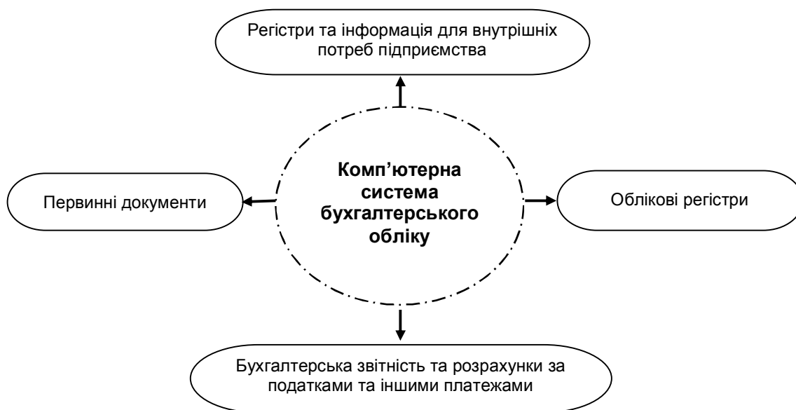
Рис. 2. Кінцеві результати роботи комп'ютерної системи бухгалтерського обліку

На даному етапі, необхідно визначити, яку інформацію система бухгалтерського обліку буде надавати в кінці певного звітного періоду або просто певного інтервалу (рис. 2).