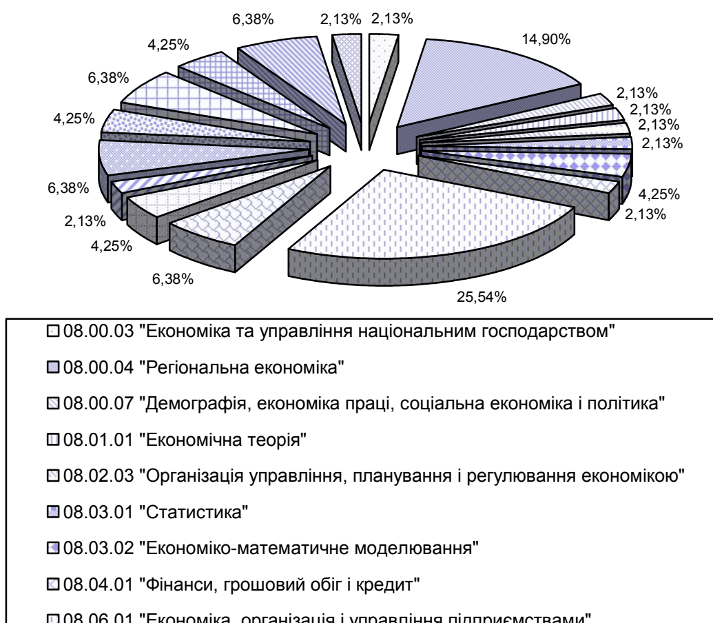
Рис. 2. Дисертації економічного напрямку, назви яких містять слово "якість", наявні у Національній бібліотеці України імені В.І. Вернадського, станом на 01.01.09

Як зазначалось вище, значна кількість дисертацій захищена з економічних наук (47 праць, що становить 48,96 % від загальної кількості), тому виникає необхідність провести аналіз дисертаційних праць за даним напрямом дослідження (рис. 2).