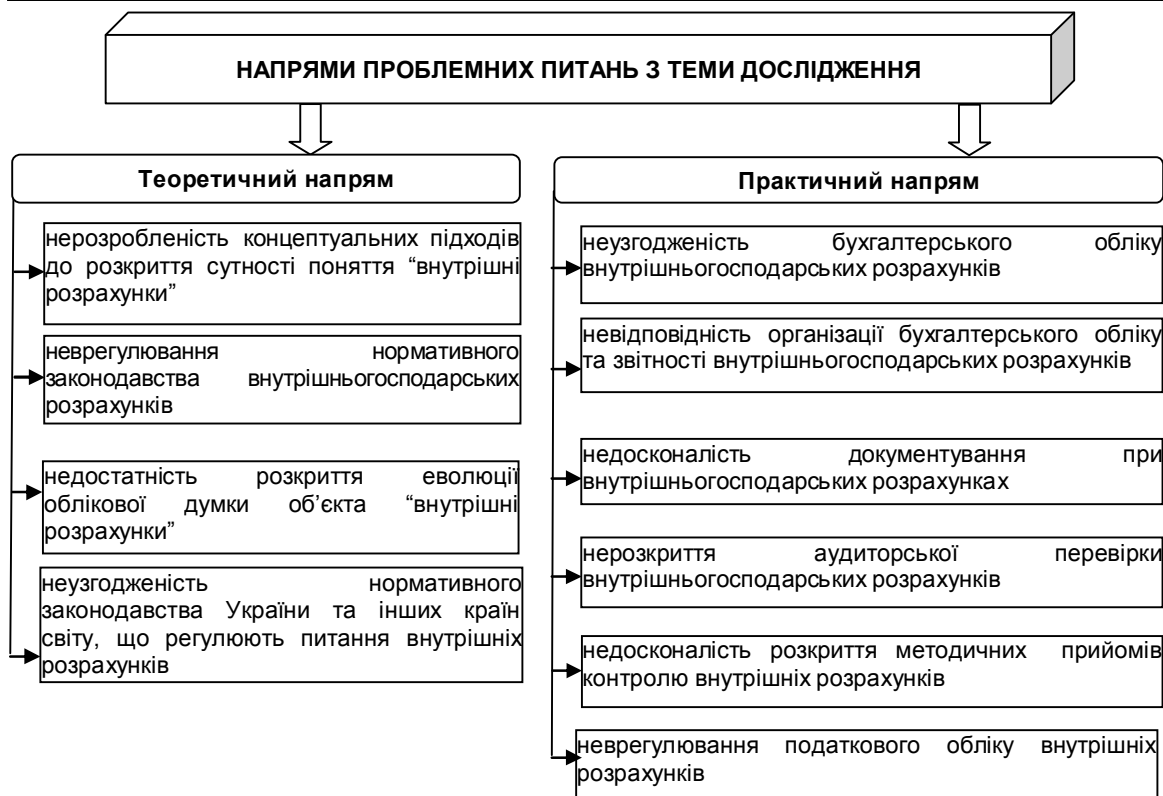
Рис. 1. Виявлені проблемні питання з обліку та контролю внутрішніх розрахунків

Враховуючи наявність великої кількості проблемних питань, які потребують уточнень і вирішення, перспективним напрямом дослідження у сучасних умовах залишається організація бухгалтерського обліку, регулювання та здійснення контролю за внутрішніми розрахунками підприємств.