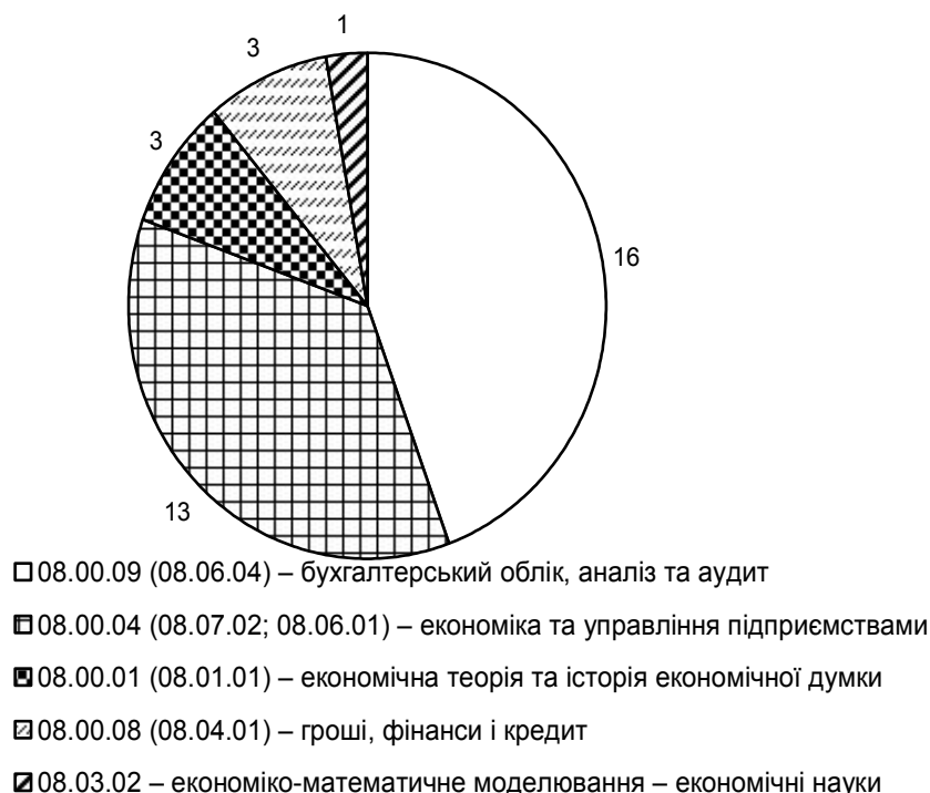
Рис. 1. Розподіл дисертаційних робіт за напрямом дослідження “власний капітал” в розрізі спеціальностей за 2000-2011 рр. (Україна)

За даними таблиці 1 побудовано діаграму кількості захищених дисертаційних робіт за напрямом дослідження “власний капітал” в розрізі спеціальностей (рис. 1).