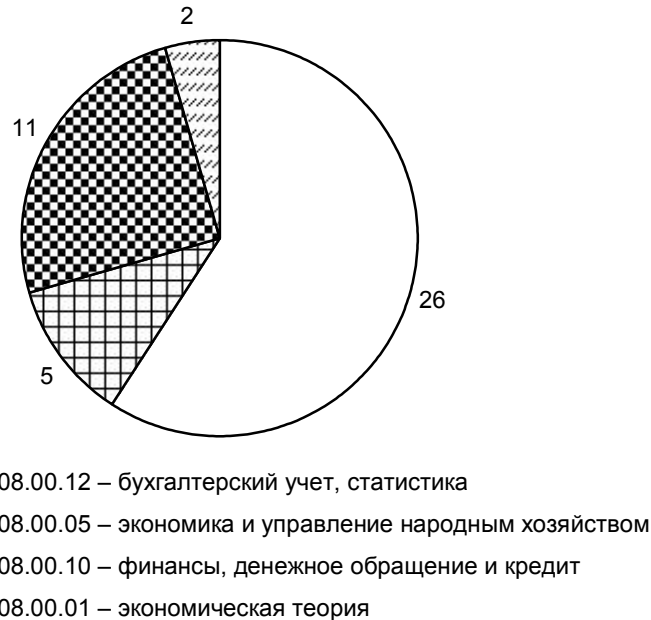
Рис. 3. Розподіл дисертаційних робіт за напрямом дослідження “власний капітал” в розрізі спеціальностей 1997-2010 роки (Російська Федерація)

На основі даних таблиці 2 побудовано діаграму кількості захищених дисертаційних робіт за напрямом дослідження в розрізі спеціальностей (рис. 3).