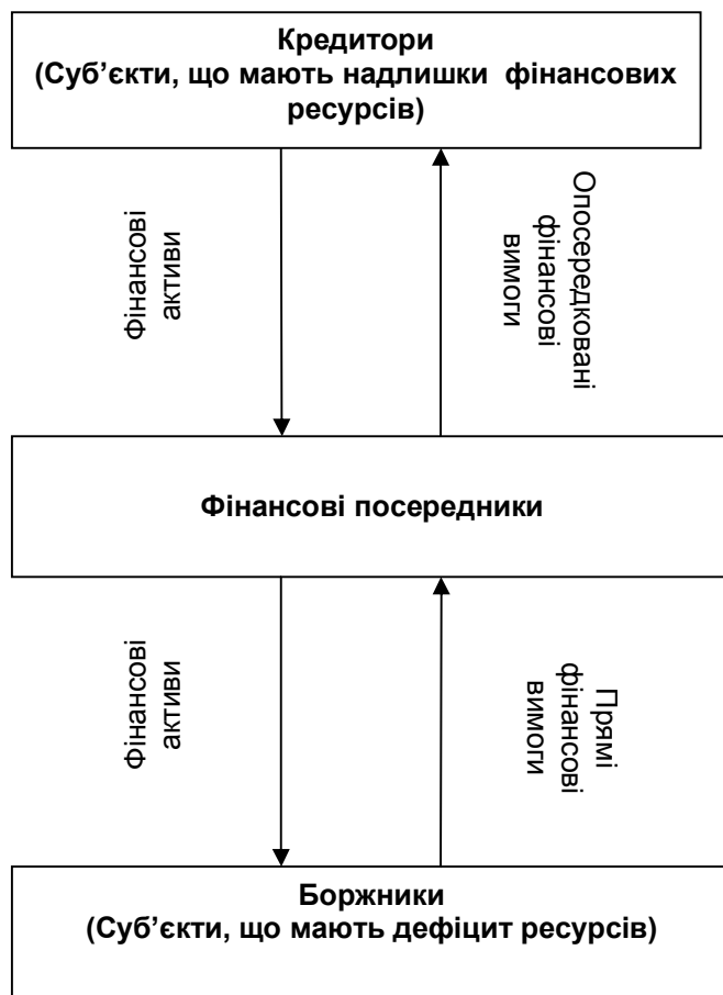
Рис. 2. Схема опосередкованого зовнішнього фінансування

та позичальникам які мають потребу в довгострокових інвестиціях. Це протиріччя служить одною з основних причин виникнення фінансових посередників, що здійснюють узгодження різних інтересів в умовах фінансового ринку й перерозподіл фінансових потоків на національному і міжнародному рівні, направляючи інвестиційні ресурси згідно зі структурою платіжного попиту й пропозиції в “точки ефективного розвитку економіки”.