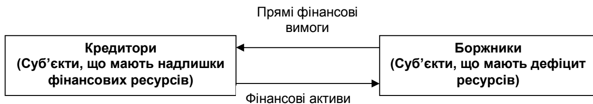
Рис. 1. Схема прямого зовнішнього фінансування

Пряме фінансування передбачає, що суб'єкти, які мають надлишок фінансових ресурсів купують фінансові вимоги у суб'єктів, які мають дефіцит ресурсів. Схема руху коштів при прямому фінансуванні наведена на рис. 1.