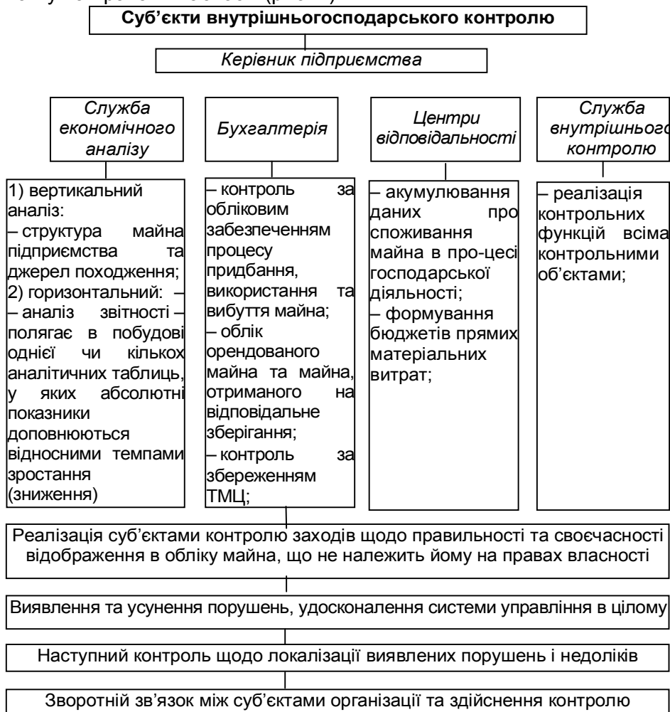
Рис. 1. Функції суб'єктів внутрішнього контролю майна, що не належить підприємству

Розглянемо функції суб'єктів внутрішнього контролю майна, що не належить підприємству на правах власності (рис. 1).