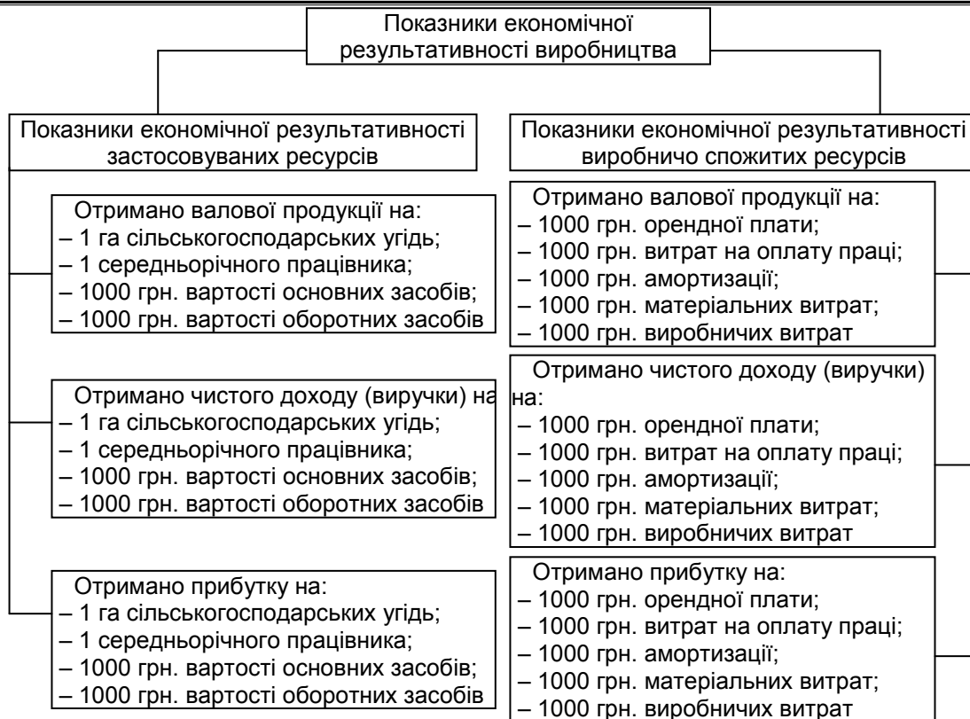
Рис. 2. Система показників економічної результативності виробництва