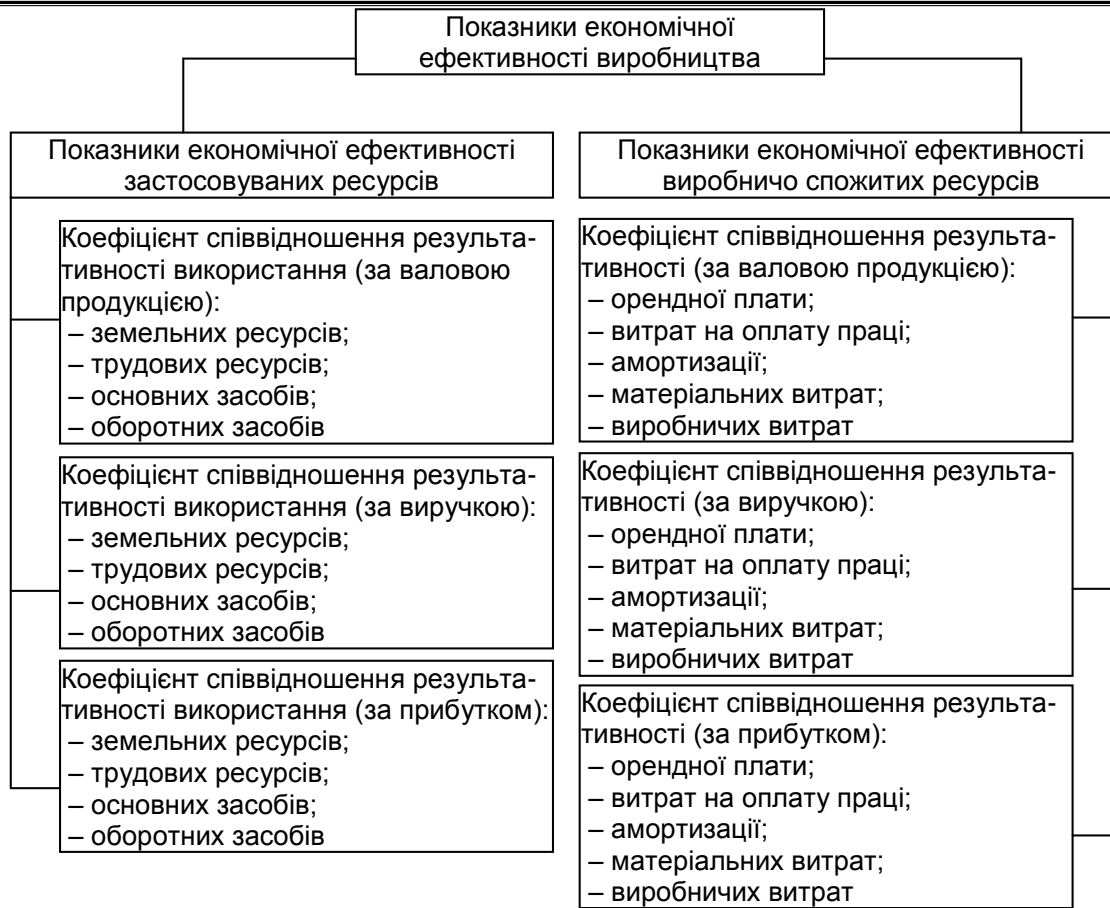
Рис. 3. Система часткових показників економічної ефективності виробництва

В зазначену систему показників не включено показники росту чи приросту корисного результату діяльності підприємства, однак у процесі кількісного виміру економічної ефективності дані показники не лише повинні бути розраховані, а й за їх значеннями (додатне чи від'ємне) приймають рішення щодо розрахунку безпосередньо показників ефективності. Зокрема, якщо за досліджуваний період приросту корисного результату не виявлено або навіть відбулося зниження його величини, то про ефективність не може йти мова. У даному випадку розраховувати безпосередньо показники ефективності можна лише в цілях аналізу причин, які зумовили відповідний стан господарювання.