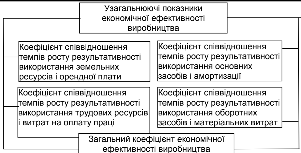
Рис. 4. Система узагальнюючих показників економічної ефективності виробництва