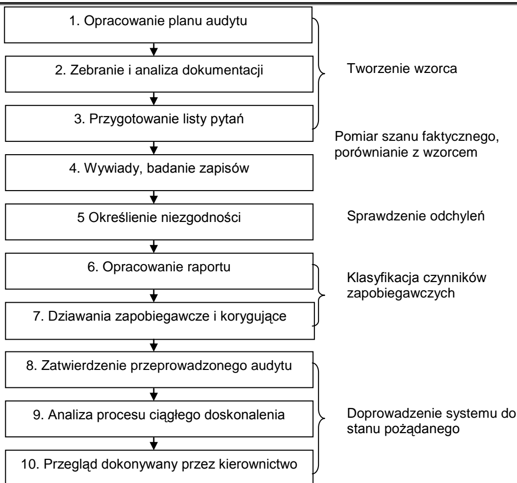
Rys. 1. Metodyka prowadzenia audytu

Głównym zadaniem audytu operacyjnego jest usprawnienie działania jednostki. Aby ten cel osiągnąć należy stosować zalecenia audytu.