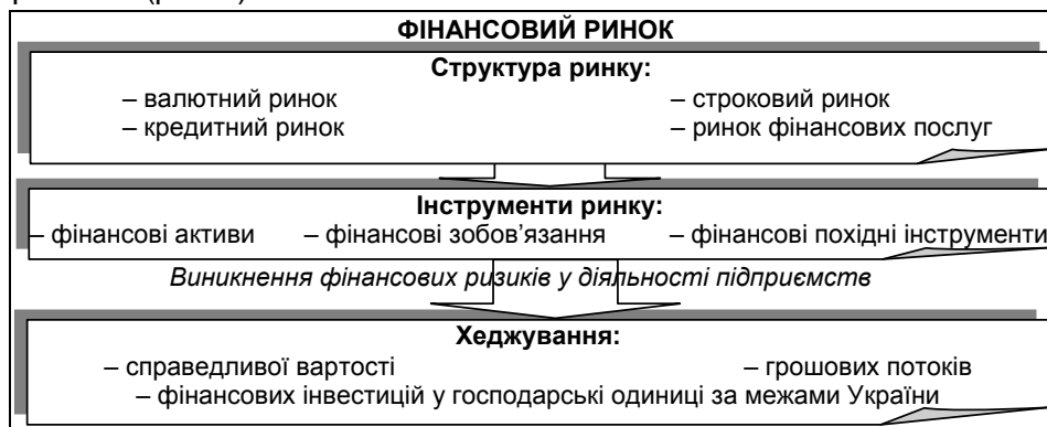
Рис. 1. Місце хеджування в системі фінансового ринку

Місце операцій хеджування в системі фінансового ринку пов'язано з мінімізацією (уникненням) ризиків, що призводять до негативних наслідків діяльності суб'єкта господарювання (рис. 1).