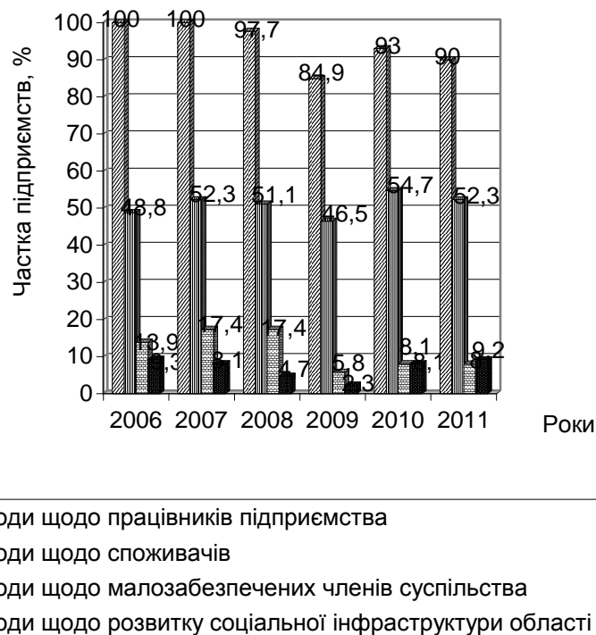
Рис. 2. Рівень здійснення соціальних програм відносно представників різних груп заінтересованих осіб

Рівень здійснення соціальних програм відносно представників різних груп заінтересованих осіб було проаналізовано на основі 86 підприємств Житомирської області різних організаційно-правових форм протягом 2006-2011 рр. (рис. 2).