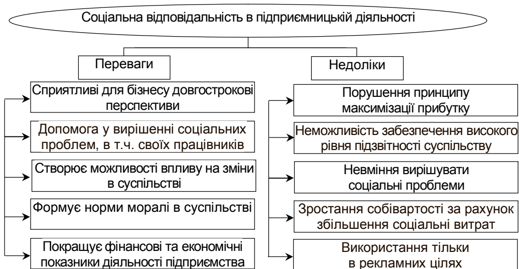
Рис. 1. Переваги та недоліки соціальної відповідальності*

Дискусії про роль бізнесу в суспільстві викликають аргументи за і проти соціальної відповідальності (рис. 1).