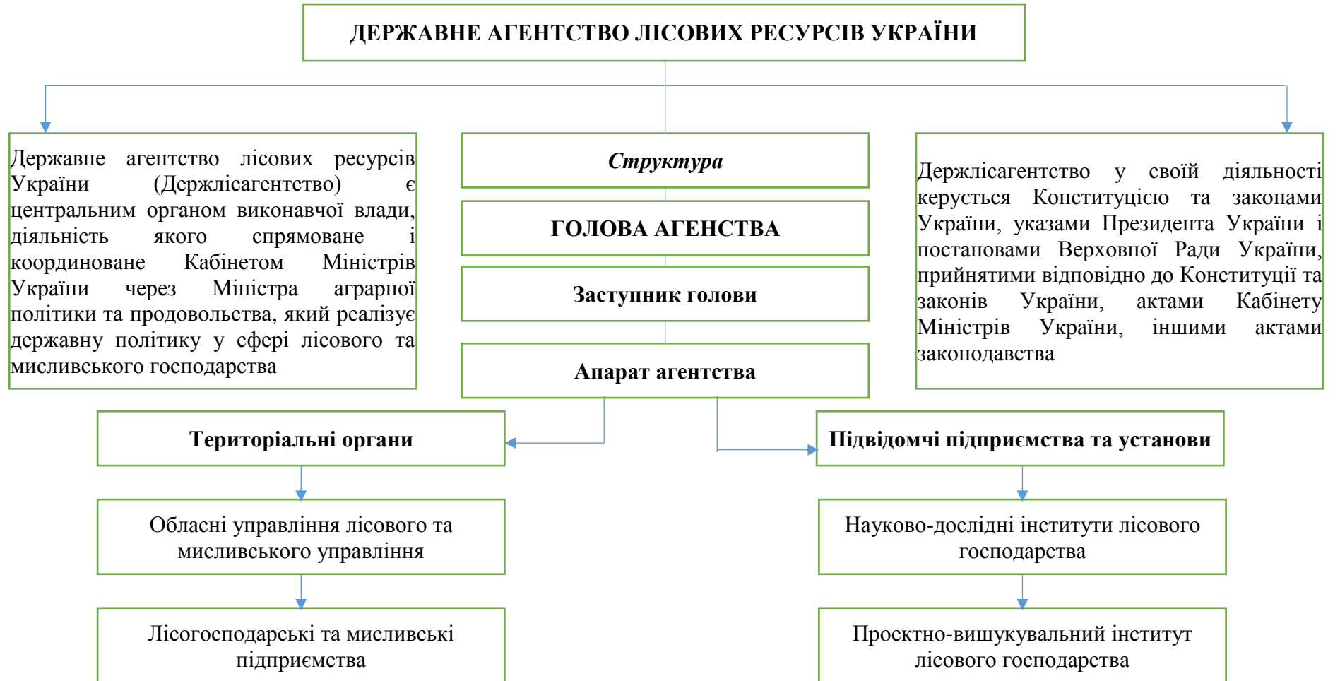
Рис. 2. Структура управління лісовим господарством України [3]