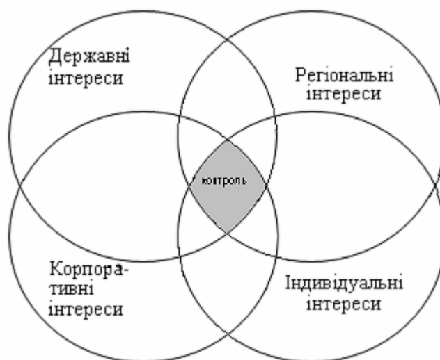
Рис 1. Контроль як переплетіння інтересів різних суб'єктів

Недостатню наукову розробленість питань державного фінансового контролю можна пояснити тим, що протягом минулих років його роль як елемента єдиної системи державного управління знижувалась, і лише кризовий стан економіки держави та державних фінансів змусив привернути увагу до практики здійснення державного фінансового контролю. Недооцінка контролю зумовлені також тим, що він здійснюється у площині переплітання державних, регіональних, корпоративних та індивідуальних інтересів (рис.1).