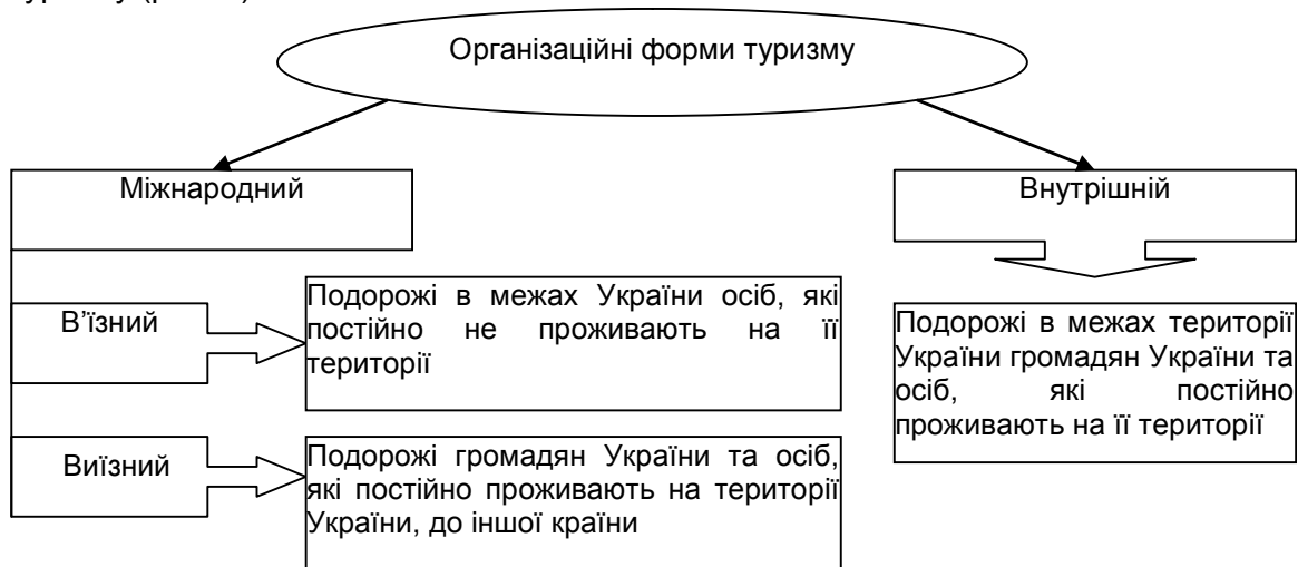
Рис. 3 Організаційні форми туризму

Такі особливості та відмінності в діяльності туристичних операторів та агентів безпосередньо впливають на методіку бухгалтерського відображення їх господарської діяльності. Але, існують й інші фактори, які безпосередньо здійснюють вплив на процес облікового відображення, зокрема організаційні форми туризму (рис. 3).