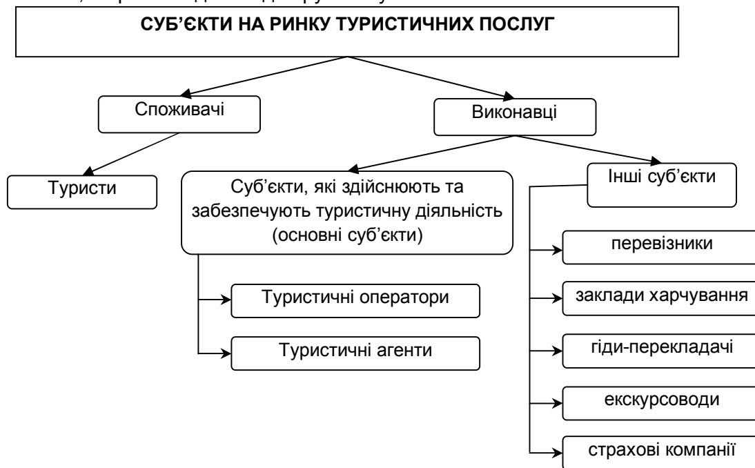
Рис. 1. Суб'єкти туристичної діяльності

Враховуючи положення ЗУ "Про туризм" та особливості туристичної діяльності, на рис.1 виділено дві групи її суб'єктів.